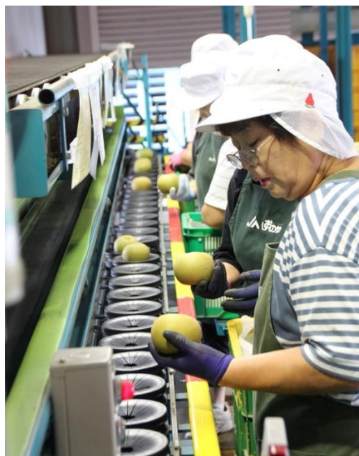
← 昨年の選果場の様子

【出荷日時】 ：8月18日（日）今年初出荷 8時30分～：選果資材準備・目ぞろえ 9時30分頃：選果開始