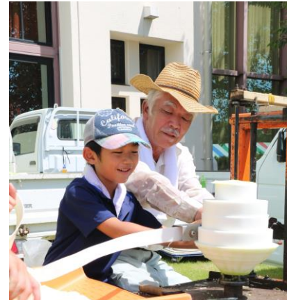
昨年のかんぴょう収穫まつりの様子