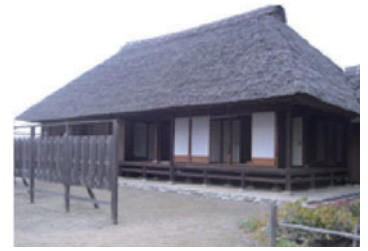
桜町陣屋跡(尊徳が26年間住んだ家屋) (真岡市二宮)

その後、幕府の役人となり、1853年(嘉永6年)に今市(現在の日光市今市)の荒廃した村の立て直しを任せられ、今市に移り住みました。農業用水路の整備や杉・ひのきの植林の奨励など、村づくり、人づくりに力を注ぎました。