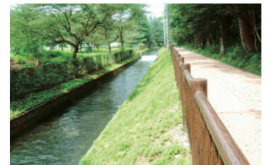
那須疏水(那須塩原市)